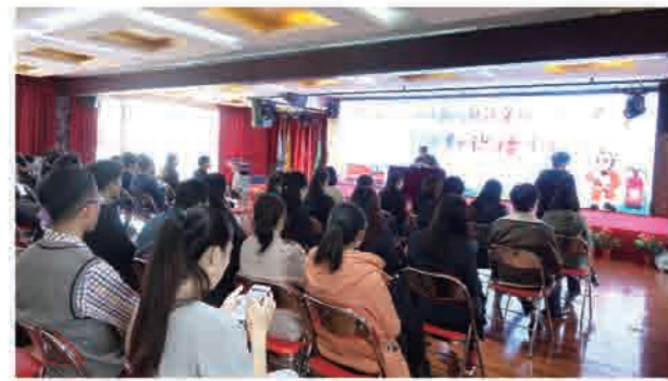
为进一步提高职工的消防安全意识和自救能力，结合办公环境及家庭生活，恒运能源集团于2016年11月17