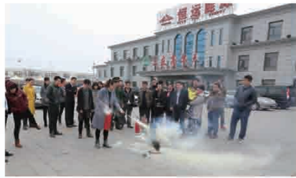
日组织了本年度第二次消防安全教育培训活动，集团总部员工100余人参加了本次培训。